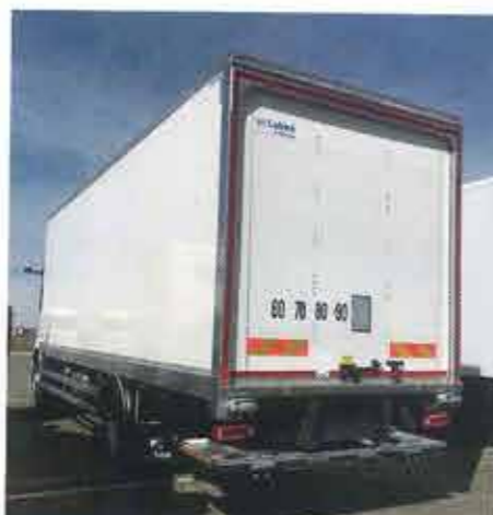
Labbe fourgon grand volume