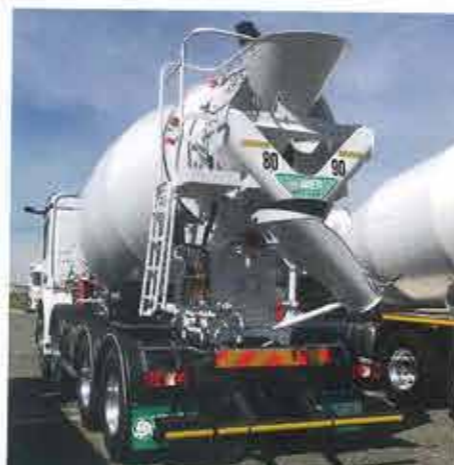
Imer bétonnière portée