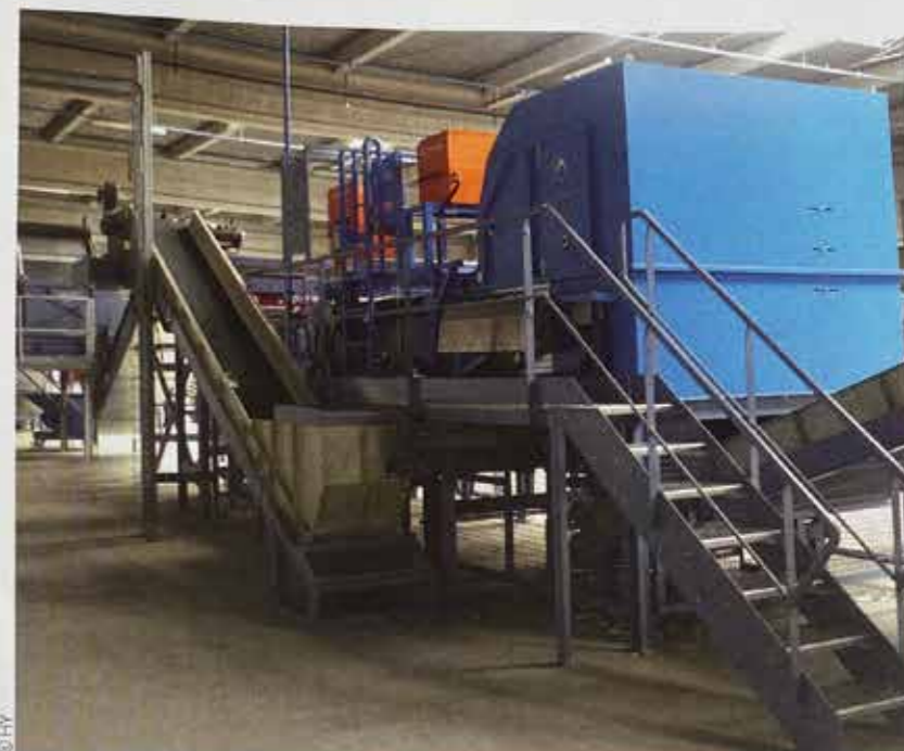
Le tri optique permet de trier en positif les éléments PET.

Le process se base sur deux réacteurs qui traitent les paillettes issues de la ligne mécanique de lavage, broyage et séparation densimétrique. Chacun d'eux a la capacité de recevoir 10 tonnes de matériaux. Dans le premier, à une température de 250 °C et pendant plusieurs heures, les paillettes sont mélangées avec du glycol, ce qui va permettre la dépolymérisation du plastique. Le produit qui en résulte, le pré-polyol, est transféré vers un second réacteur, lui aussi à 250 °C, où le processus chimique est finalisé pendant plusieurs heures par l'ad-