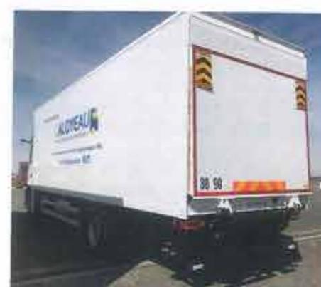
Laloyeau fourgon grand volume