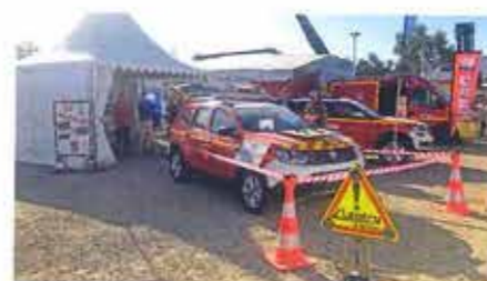
LANERY : véhicule de commandement équipé d'une plate-forme pour drones.

Nous pouvons féliciter les entreprises exposantes et adhérentes de la FFC CONSTRUCTEURS représentatives des savoir-faire techniques et exigeants de notre filière : BSE AMBULANCES ; ELITT ; le Groupe GRUAU avec GIFA, PETIT-PICOT, LABBE, LANERY et SANICAR ; KLUBB France ; MERCURA ; MVR Evolution ; PROCAR DEMAS ; TECHNAMM ; T.I.B. et le Groupe VINCENT.