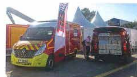
VSAV cellule exposé sur le stand TIB.