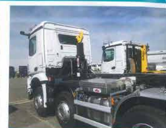
Hyva bras de levage