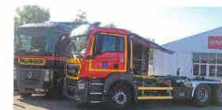
VINCENT : porteur pour berce de décontamination ou caisson mobile de commandement.