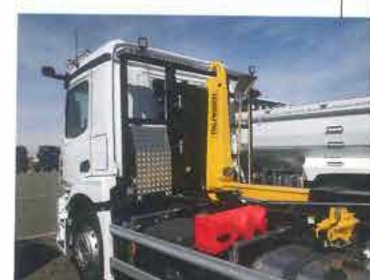
Palfinger bras de levage