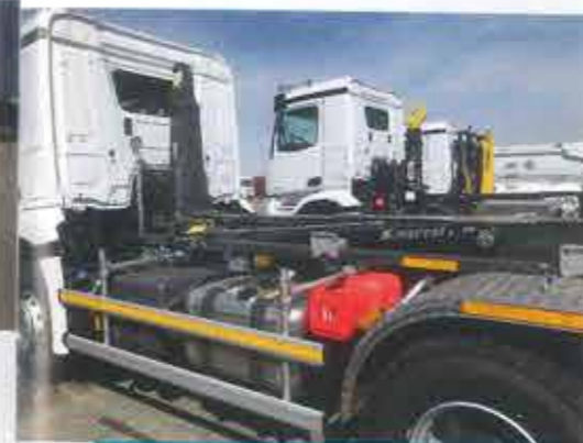
Marrel bras de levage