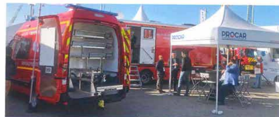
PROCAR Demas : fourgon plongeur et poste de commandement pour les risques technologiques.

Autre champ d'activité important : le carrossage de poids-lourds en camion citerne, notamment forestier et mon-