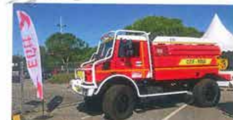
CCF carrossé par ELITT.