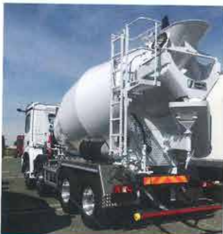
SCHWING-STETTER Bétonnière portée