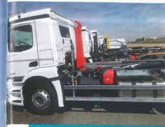
Dalby bras de levage