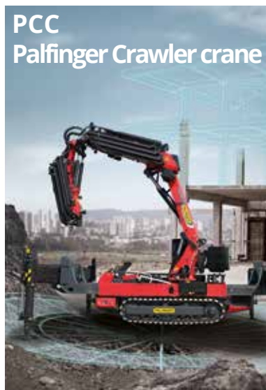
PCC Palfinger Crawler crane

Pour vos besoins de manutention de charges lourdes, les grues PALFINGER de la gamme SH vous offrent longue portée , précision et fiabilité .