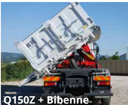
Q150Z + Bibenne