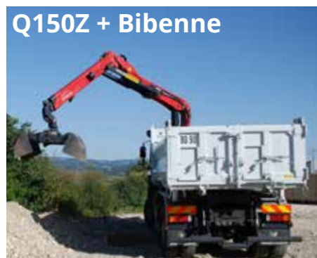
Q150Z + Bibenne